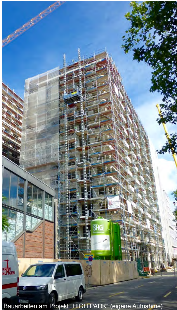
Bauarbeiten am Projekt „HIGH PARK“